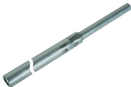
Zobrazení je nezávazné