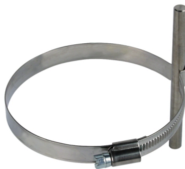
Zobrazení je nezávazné