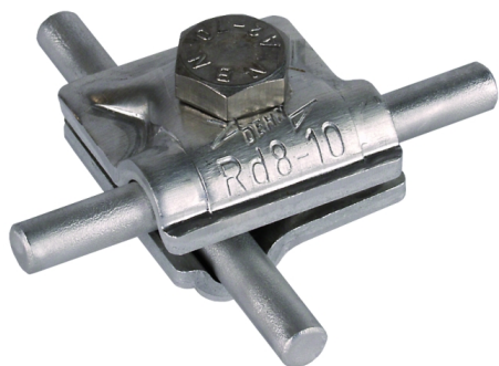
Zobrazení je nezávazné