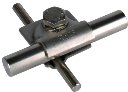
Zobrazení je nezávazné